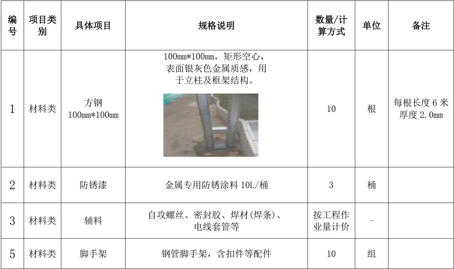
攀枝花市西区第二幼儿园维修户外电动遮阳棚项目清单表